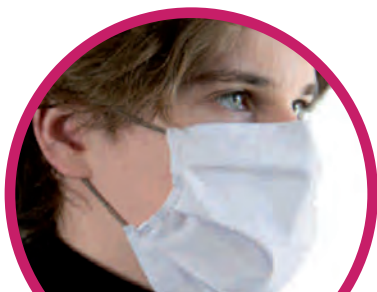
Vier Maskenfarben lieferbar.