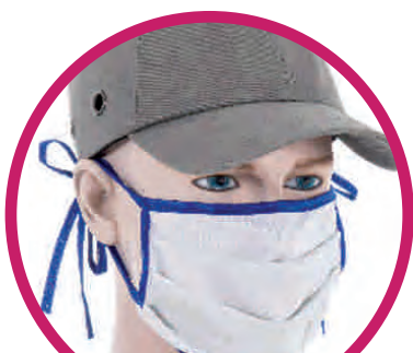
Verschiedene Bänderfarben lieferbar

Gepackt à 20 Stck, ohne Label, Preise in EUR zzgl. MwSt. Drucktechnik: Siebdruck, 1- bzw. 2-farbig, jede weitere Farbe zzgl. 0,20/Stck. Max. 16 Farben möglich. Siebdruck auf eine farbige Maske zzgl. Zusatzfarbe "Weiß" ) umweltfreundlicher Sublimationsdruck, 4c